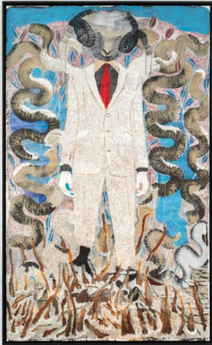
«Man and Superman I», 2020. Acrylique, crayon, huile, encre de Chine et stylo Bic sur carton. 250 x 150 cm. - Isabelle Arthuis / Templon.

Repoussant les codes de la peinture traditionnelle, Omar Ba peint sur des rouleaux de toile brute ou de larges cartons posés à même le sol. Il prépare ses fonds noirs avant de les recouvrir librement d'un peuple chimérique, humain, animal et végétal, qui suggère des narrations et des métaphores puisées à la fois dans la vie quotidienne et les cultures ancestrales africaines, comme ce portrait de femme dirigeante inspiré d'une figure existante : une « personne exceptionnelle » à qui il voulait rendre hommage en la montrant dans sa puissance et sa sagesse : « En Afrique les femmes au pouvoir sont encore très rares. Si on changeait, qu'est-ce que ça donnerait ? »