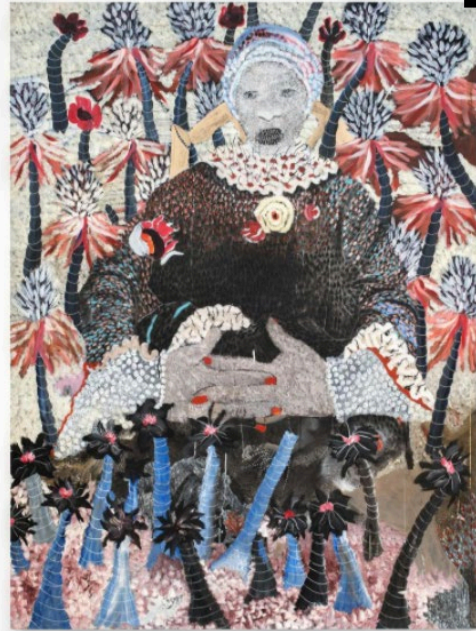
«I am not a Toy», 2020. Acrylique, crayon, huile, encre de Chine et stylo Bic sur toile. 200 x 150 cm.